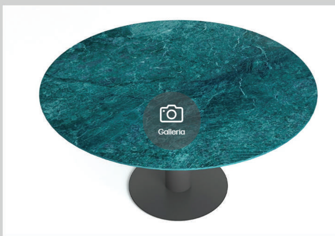
In questa galleria: progetti di Michela Baldassari e di Silvia Sandini

Leggi anche: La mostra "Architetture per l'acqua", curata da Vincenzo Pavan nell'ambito di Marmomac 2018, invita progettisti e aziende ad ideare spazi onirici utilizzando la pietra e l'acqua.